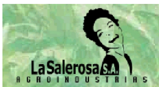
La Salerosa S.A. Agroindustrias