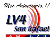
Lv4 San Rafael