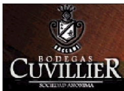
Bodegas Cuvillier S.A.